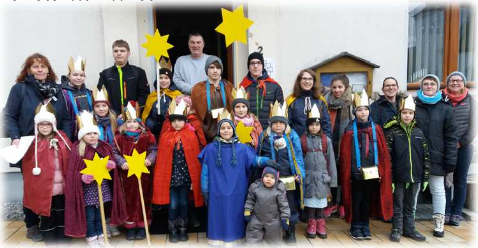
Brandoberndorfer Sternsinger wie jedes Jahr voll motiviert!