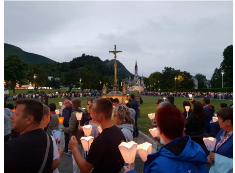
Lichterprozession in Lourdes

Der Name des Festtages hat sich im Laufe der Kirchengeschichte