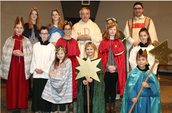
Sternsinger im Gottesdienst in Braunfels