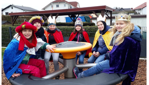
Schwalbacher Kinder in Laufdorf