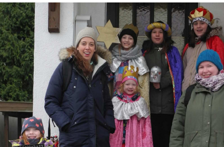
Laufdorf mit Nachwuchs-Königen