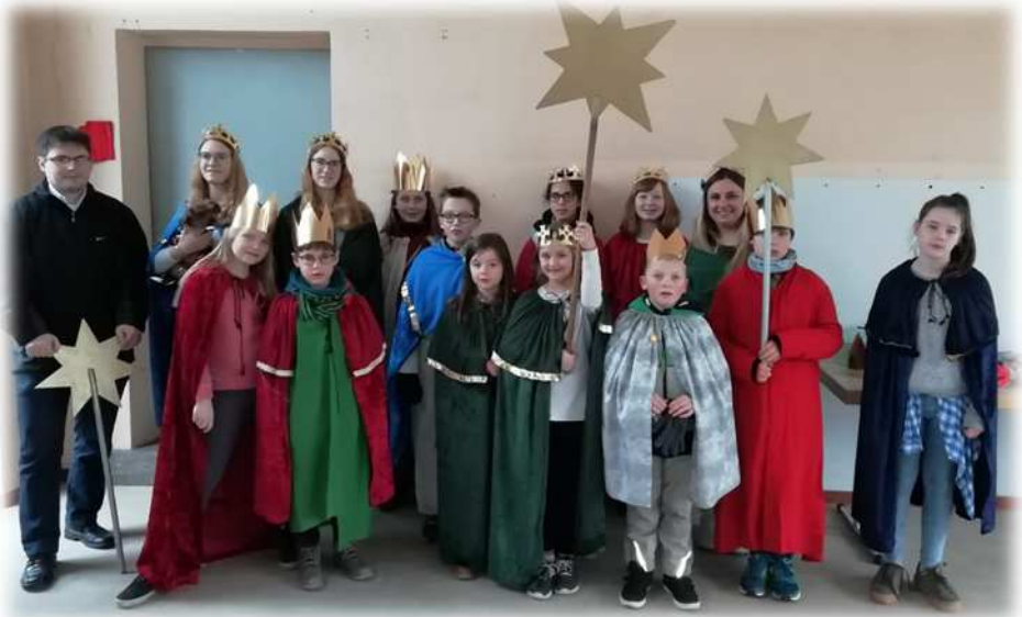
Die Weisen aus Braunfels