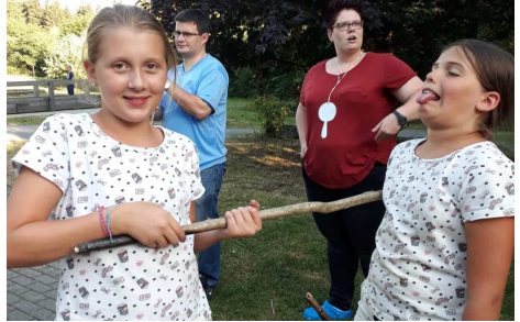
Mord und Totschlag in der Bibel - in Westernohe zum Glück nur Spaß!