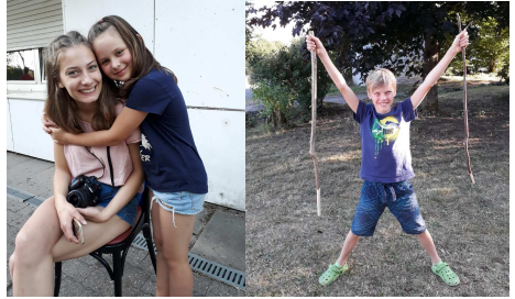
Betreuer und Kinder - meist ein Herz und eine Seele!

Unglaublich: Da wird gemordet, betrogen und geschummelt, was das Zeug hält - und all das in der BIBEL!! Zum Glück hatte das Krimi-Team sehr fähige und motivierte Nachwuchs-Kriminologen dabei, um die kniffligen Fälle zu lösen.