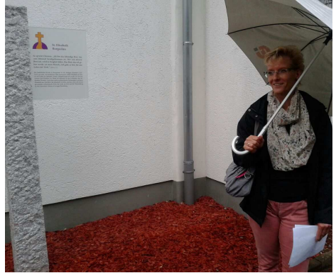
Stele an der St. Elisabeth Kirche in Burgsolms

Begonnen haben wir an der katholischen Kirche und sind über die evangelische Kirche zum Weltladen gegangen. Bei den Stationen wurde schon fleißig diskutiert. Dabei stellten wir fest, dass es dem eigenen Glauben sehr gut tut, wenn man sich mit anderen austauscht. Nur so kann manches, was einem auf dem Herzen liegt, hinterfragt oder gefestigt werden, aber auch der Glaube wachsen. Die Stele bei den Stolpersteinen rechtfertigte eine längere Pause. Der biblische Text beinhaltete ein paar Zeilen aus dem Gleichnis des verlorenen Sohnes. Die Gedanken dazu be-