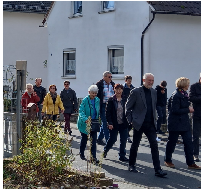
Prozession von der ev. Kirche zur kath. Kirche

Die Gastfreundschaft der evangelischen Kirche trug dazu bei, dass Integration, wie man heute sagt, gelingen konnte. Dass die Flüchtlinge, wie sie ja auch oft genannt wurden, selber zur Beheimatung in Schwalbach beisteuerten, will ich nicht verschweigen. Ab den fünfziger Jahren bauten sie, u.a. um der Enge der Wohnverhältnisse zu entfliehen, ihre eigenen Häuser. Hinzu kamen weitere Faktoren: Vertriebene und Einheimische hatten oft einen gemeinsamen Arbeitsplatz. Die Kinder drückten dieselbe Schulbank oder spielten gemeinsam in ein- und demselben Fußballverein. Frauen und Männer schlossen sich den Chören oder Feuerwehren an. Die Katholik*innen feierten Fasching und führten das ungarische Kesselgulasch ein. In Schwalbach und vielen anderen umliegenden Orten ist es gelungen, die Fremden aufzunehmen. Dafür sagen wir seitens der katholischen Kirche heute vielen herzlichen Dank und rufen Ihnen ein „Vergelt's Gott“ zu.