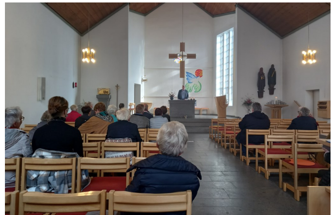
Abschluss in der kath. Kirche

Als Zeichen des Dankes laden wir Sie alle ein – zu Essen und Trinken. Die Männer vom Männerkochkurs haben für uns alle „Kesselgulasch“ gekocht.