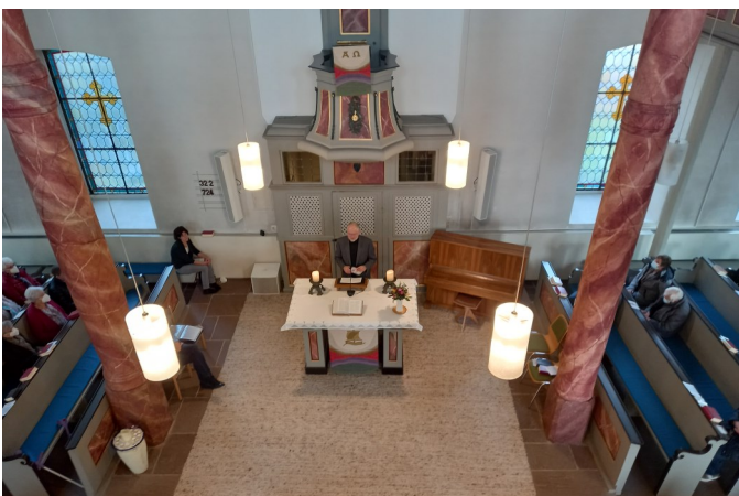
Ök. Gottesdienst am 31.10.2021