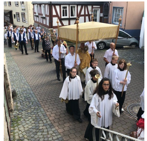
Prozession durch die Straßen von Braunfels und Hüttenberg

Wir feiern, dass unser Herr Jesus unter den Gestalten des Brotes und des Weines bei uns ist: Zu sehen, zu schmecken, zu berühren. Brot - zumindest für Menschen des Abendlandes und rund ums Mittelmeer - war und ist das Grund-