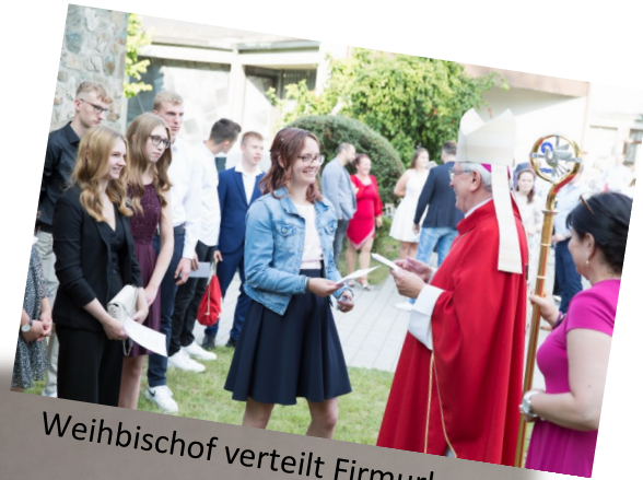
Weihbischof verteilt Firmurkunden

72 Jugendliche wurden am ersten Wochenende im September in St. Anna, Braunfels von Weihbischof Thomas Löhr gefirmt.