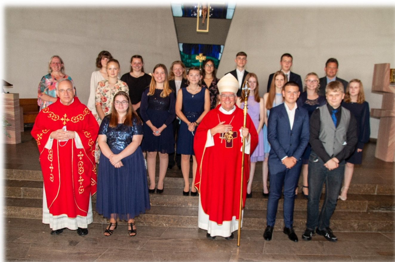
Firmkurs „to-Do“ und „Kreativ“ am 05.09.2021 um 16.00 Uhr