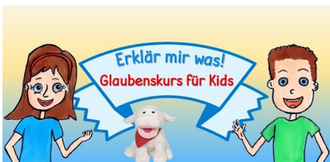
Gemalt von Lisa Wagner