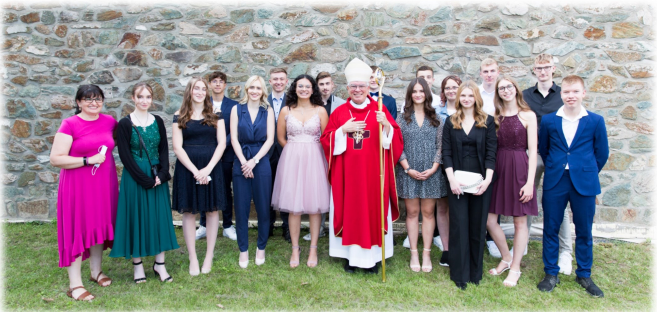
Firmkurs „Erlebnis“ am 04.09.2021 um 16.00 Uhr