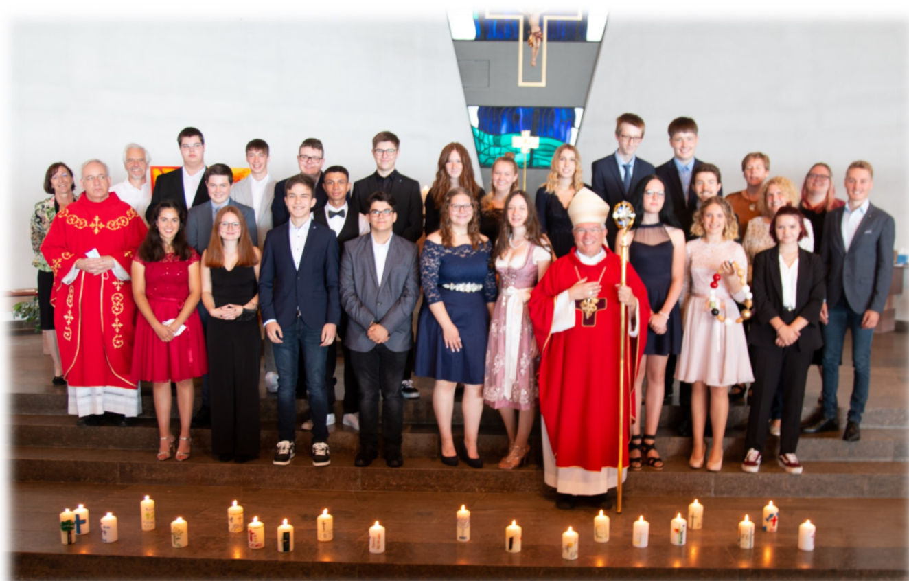
Firmkurs „Fahrrad“ und „Wochenende“ am 05.09.2021 um 10.30 Uhr