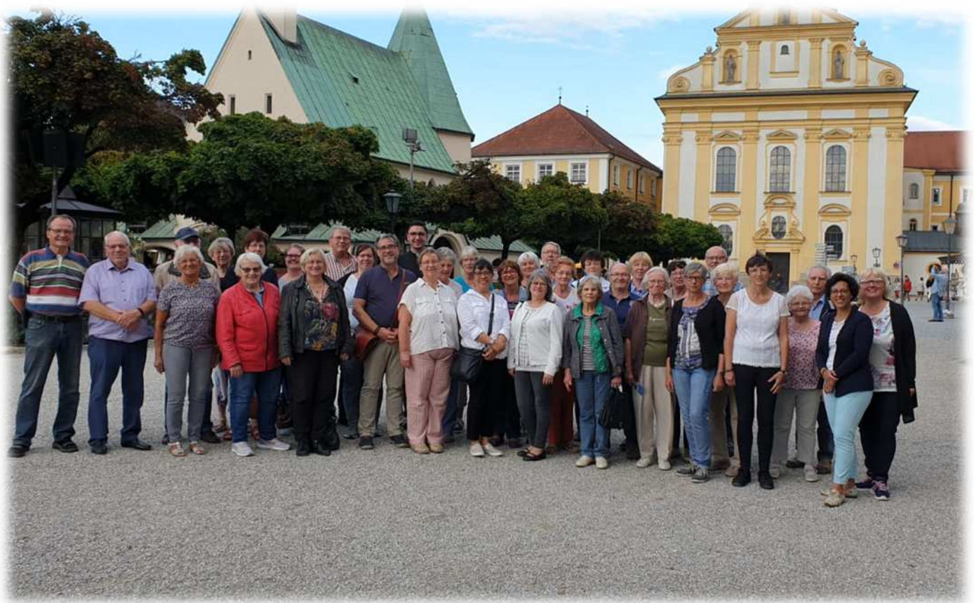
Gruppenfoto der Wallfahrt nach Altötting im August 2019

In der Vielfalt unserer Pfarrei und durch ihre herzliche Aufnahme habe ich mich sehr wohl gefühlt. Mit Freude denke ich an die gemeinsamen Gottesdienste, die Wallfahrten nach Fatima, Lourdes und Altötting, die verschiedenen Feste, oder einfach an die vielen guten Gespräche mit den Gläubigen zurück.